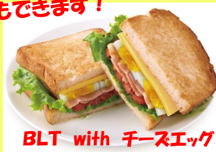
BLT with チーズエッグ 520円