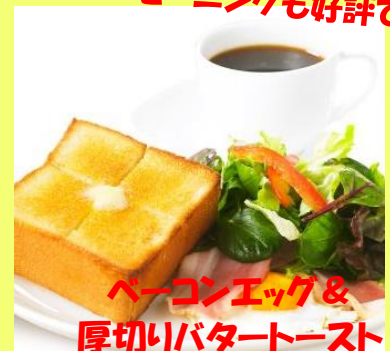
モーニングも好評です♪ ベーコンエッグ& 厚切りバタートースト 650円