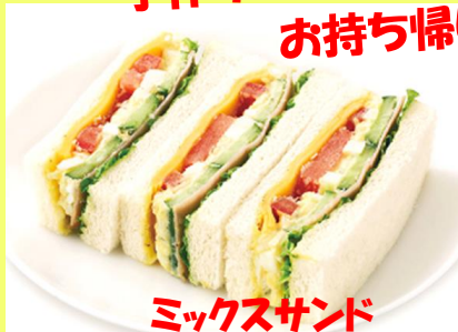
ミックスサンド 390円